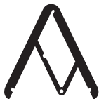
2018 Adi Compasso D'oro Career Award